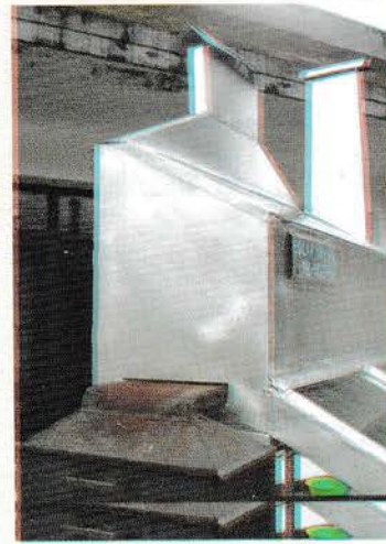
चित्र नं. १ (क) हाईब्रिड सोलार ड्राएरको साईडको भाग ।

घ) आलौ माछा १००० ग्राम छ भने नून १ चिया चम्चा, बेसार १/४ चिया चम्चा, अमिलो (चूक) १ चिया चम्चा, टिम्पुर १/२ चिया चम्चा र भटमासको तेल १/२ चिया चम्चा राख्नु पर्दछ ।