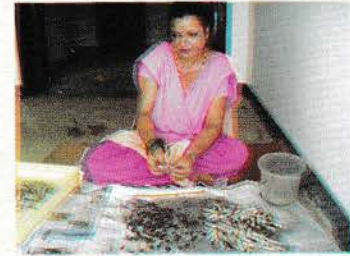
चित्र नं. २ माछाको आन्द्राभुडि निकालेर फ्याक्दै गरेको ।