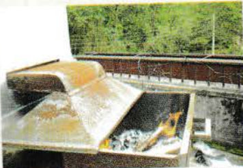
चित्र नं. ४ हाईब्रिड सोलार ड्राएरको आगो बाल्ने ठाउँ ।