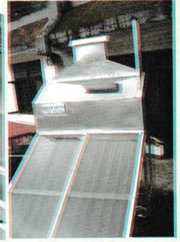
चित्र नं. १ (ख) हाईब्रिड सोलार ड्राएरको सामुनेको भाग ।