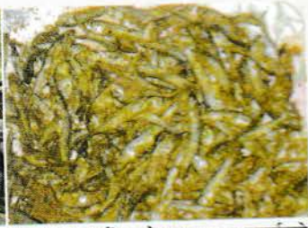
चित्र नं. ५ हाईब्रिड सोलार ड्राएरमा सुकाईएको खानको लागि तैयारी माछा ।